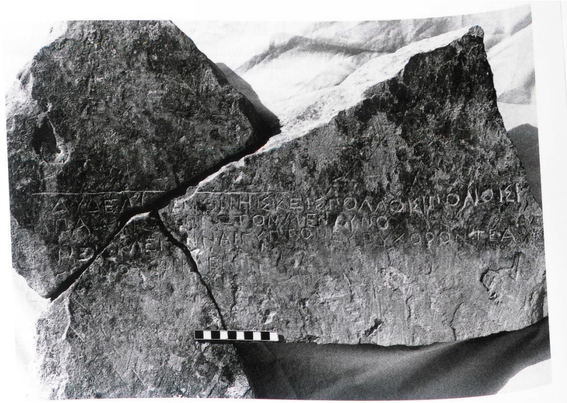
Fig. 9. La fotografia dell'epigrafe. (Chamberlaine 2001)