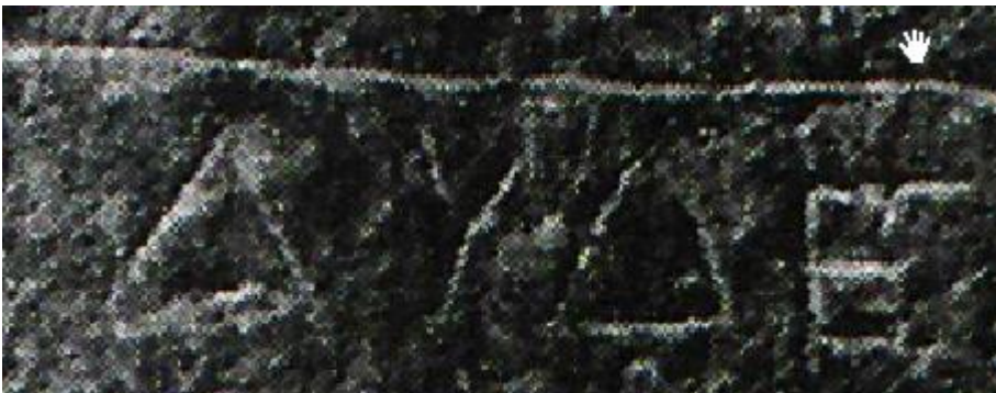
Fig. 2a. Particolare ingrandito prime quattro lettere e linea orizzontale. (Rielaborazione di Alessia Gonfloni).