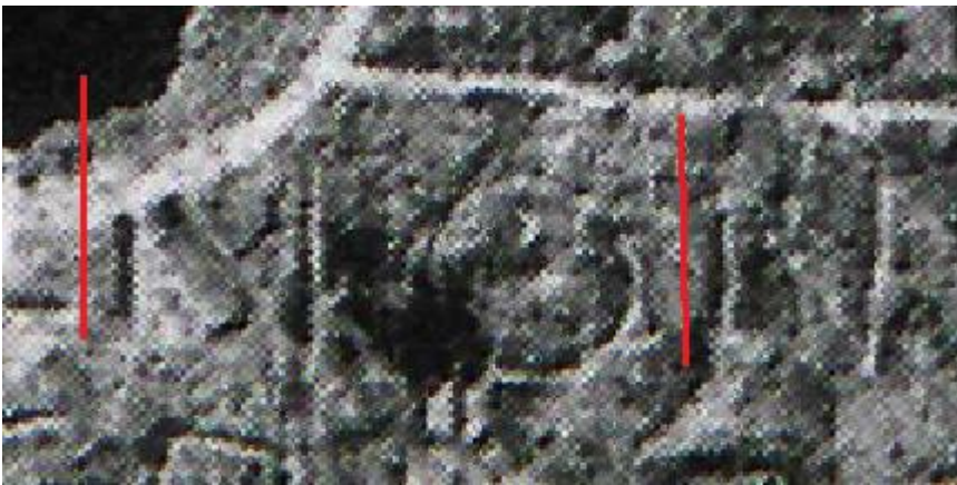
Fig. 3-4-5. Particolari ingranditi di confronto fra le aste di N. (Rielaborazione di Alessia Gonfloni).