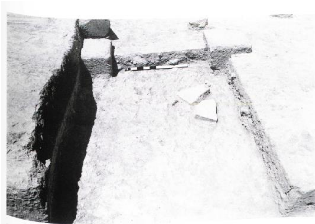
Fig. 1. Frammenti b) e c) ritrovati nella fossa di riempimento dell'Apodyterion. (Chamberlain 2011).