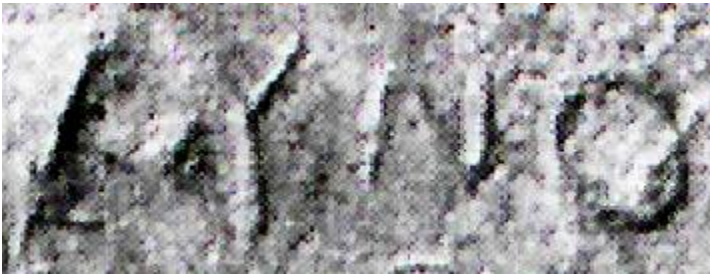
Fig. 8. Particolare ingrandito con risoluzione a contrasto negativo ZYNO. (Rielaborazione di Alessia Gonfloni).