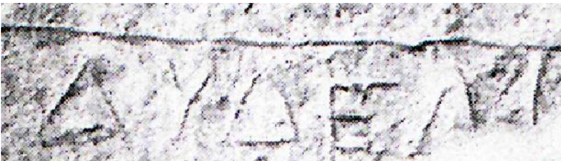
Fig. 2b. Particolare ingrandito con risoluzione a contrasto negativo prime 6 lettere. (Rielaborazione di Alessia Gonfloni).