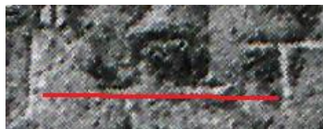
Fig. 6-7. Particolare ingrandito altezze di ω. (Rielaborazione di Alessia Gonfloni).