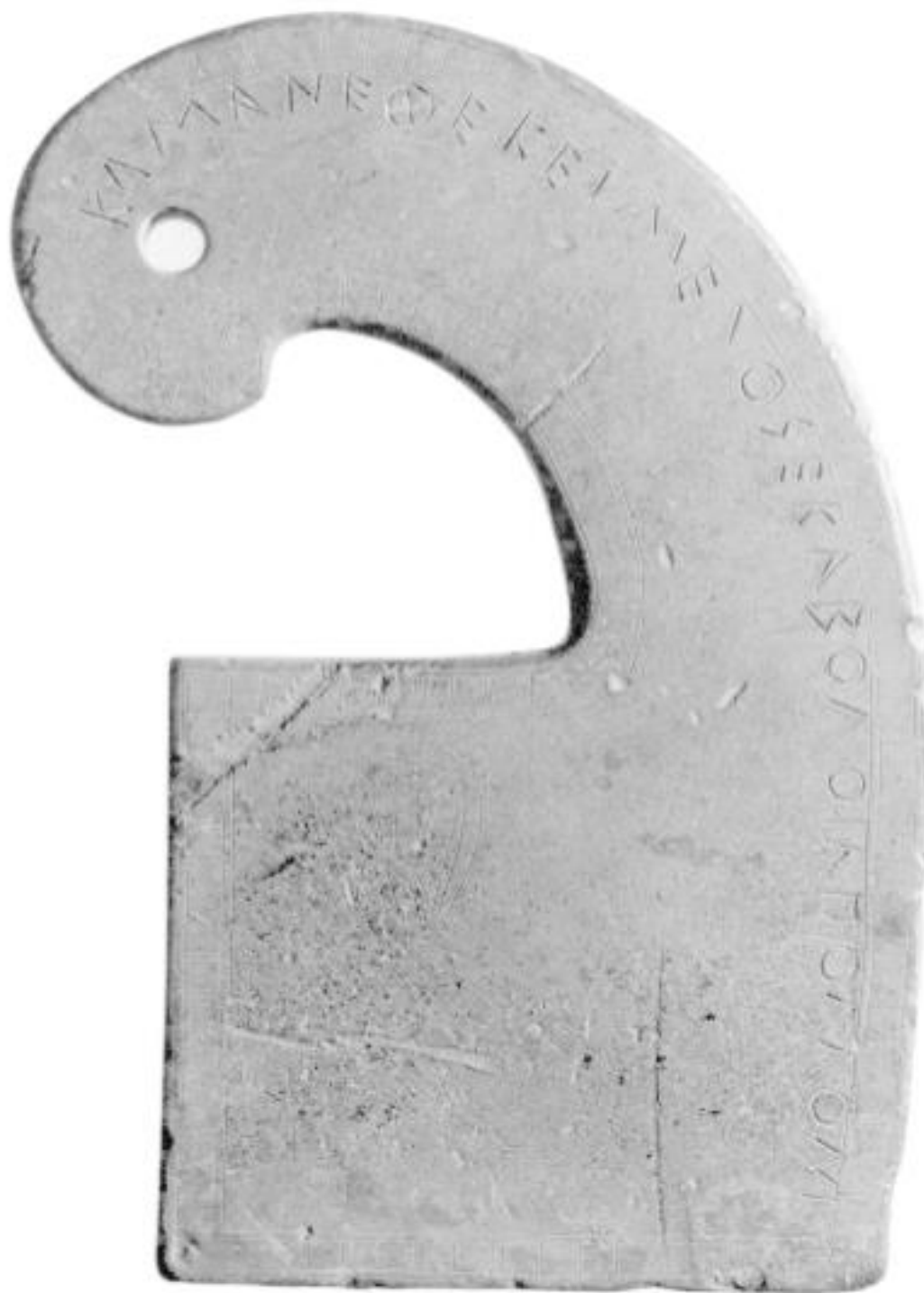
Fig. 2. Fotografia da Knoepfer 1994, p. 338.