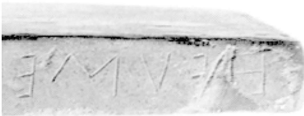
Fig. 5. Sezione iniziale dell'iscrizione ametrica.