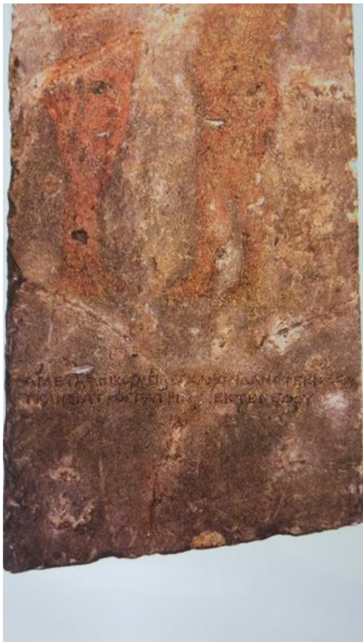
Fig. 4. Iscrizione e danno porzione inferiore a destra.