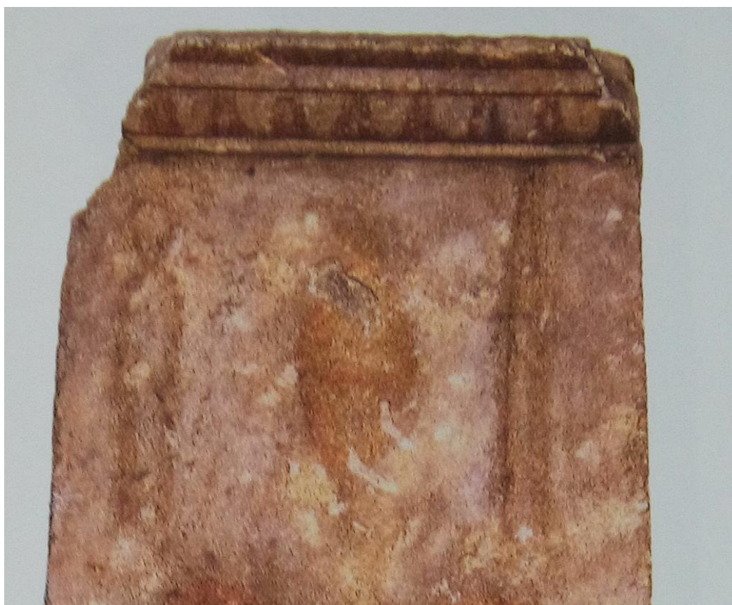
Fig. 3. Porzione superiore con angolo danneggiato, decorazione pittorica e strumenti. Fotografia da Carter 2003, p. 144.