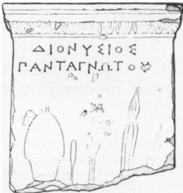
Fig. 6. La stele di Dionisios, disegno da Hillert 1985, p. 418.