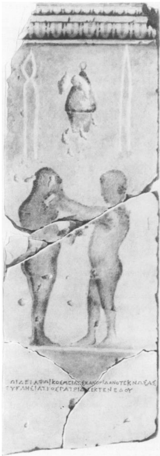
Fig. 1. La stele. Fotografia da Solomonik – Antonova 1974 (Abb. 1).