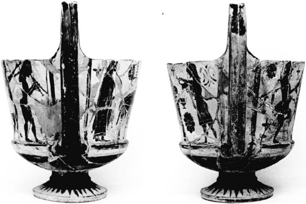
Fig 5 – Visioni laterali.