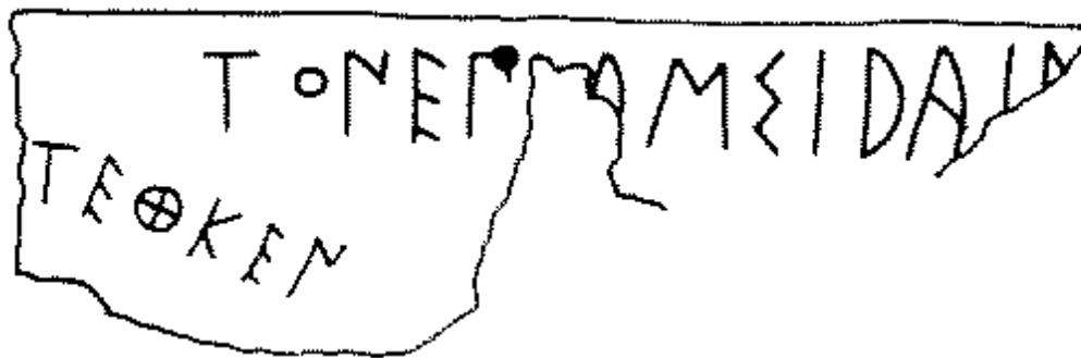
Fig. 9. Frammento dall'Acropoli Ateniese, Bronze lebetes , IG 1 2 .406, 1 3 .585; 700-600 a.C.