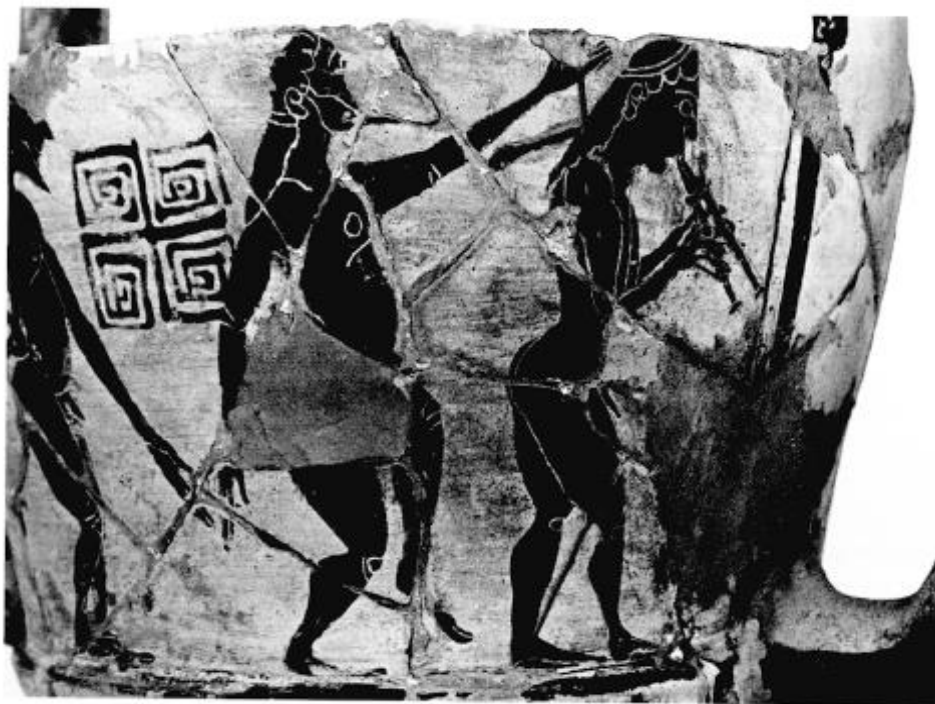
Fig. 2 – Dettagli lato A. Fotografia da Maffre 1999, p. 14