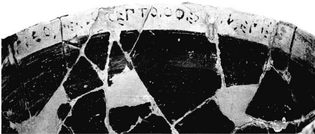
Fig 6a, 6b – Immagine dell'iscrizione dal catalogo di Maffre 1999, p. 16.