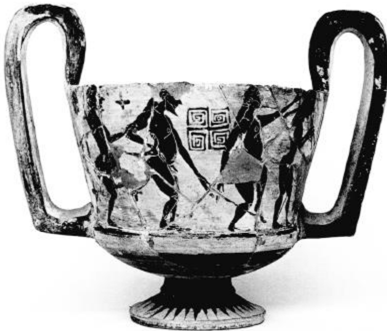
Fig. 1 – Kantharos, lato A.