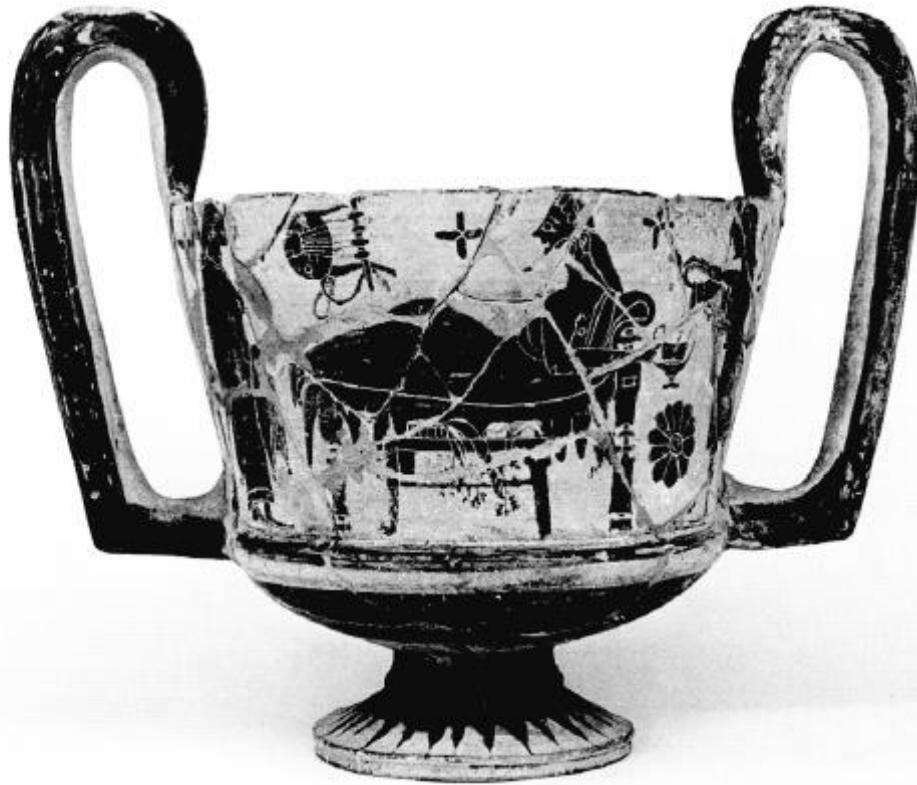
Fig 3 – Lato B. Fotografia da Maffre 1999, p. 15.