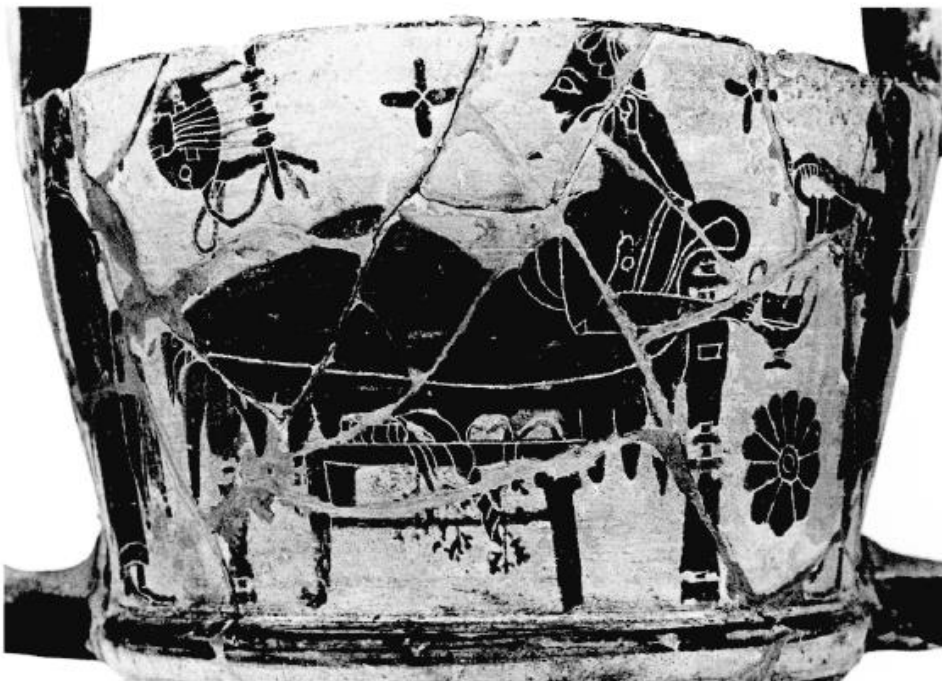
Fig. 4 – Dettagli lato B. Fotografia da Maffre 1999, p. 15.