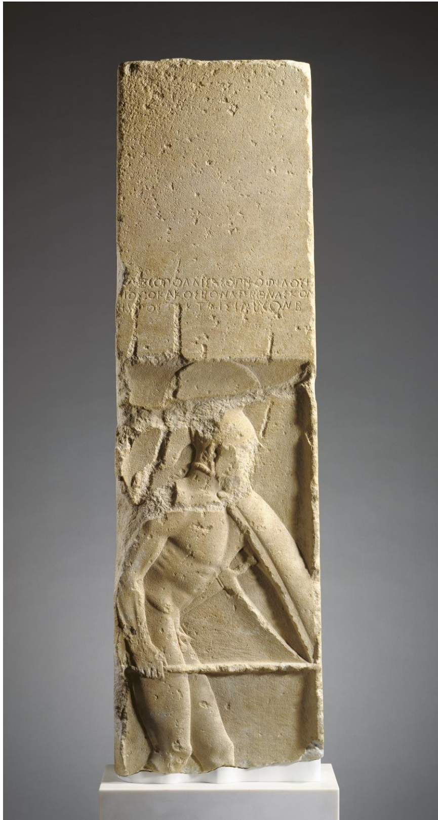
Fig. 1. La stele di Pollis.