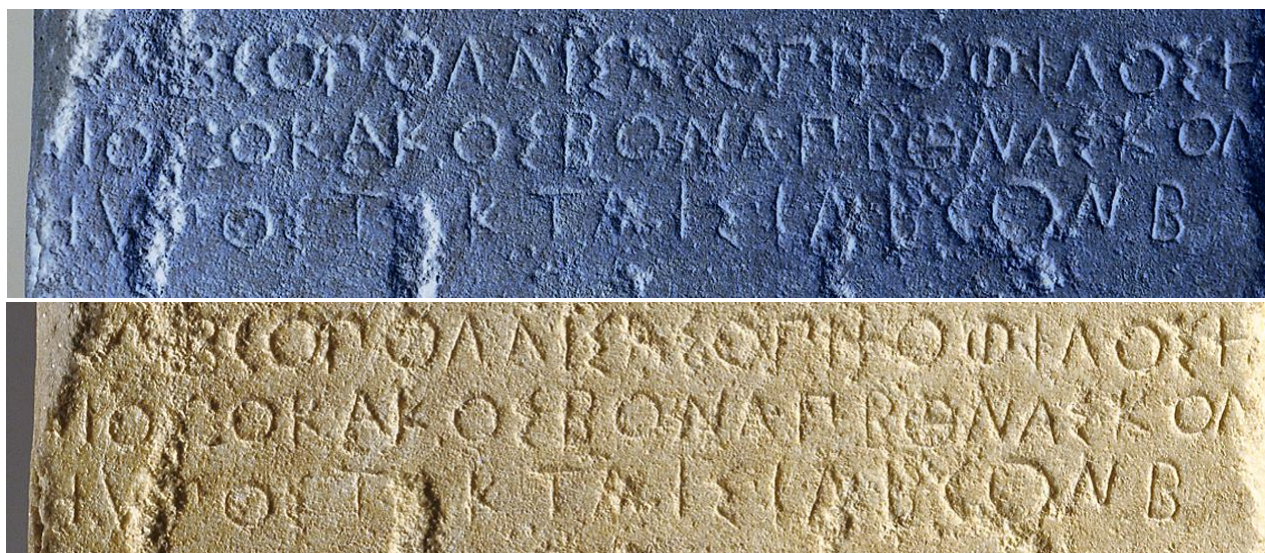
Fig. 6. Epigramma versione in negativo (in alto) e originale (in basso).