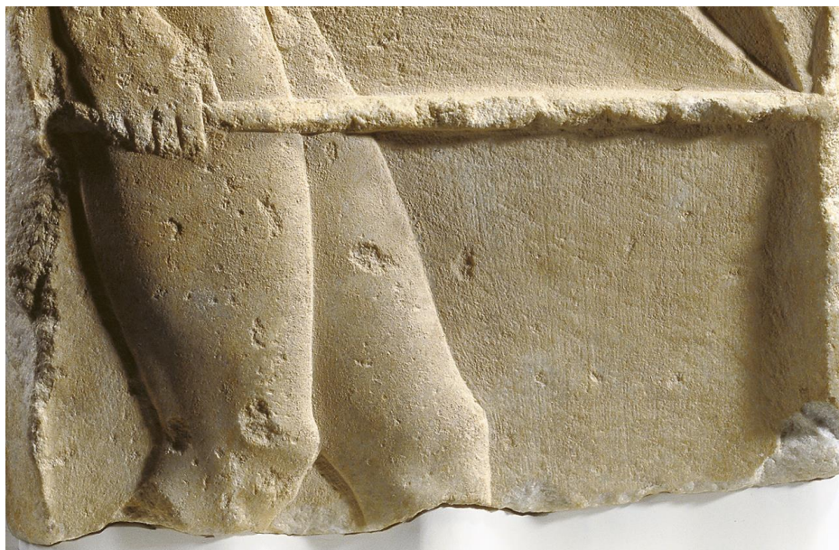
Fig. 5. Particolare ingrandito della lancia e delle ginocchia.