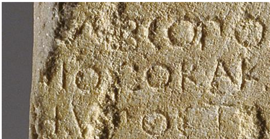
Fig. 2. Particolare ingrandito dell'epigramma: sezione laterale a sinistra delle prime tre linee. Si noti la parte mancante che interessa anche la perdita di alcune lettere.