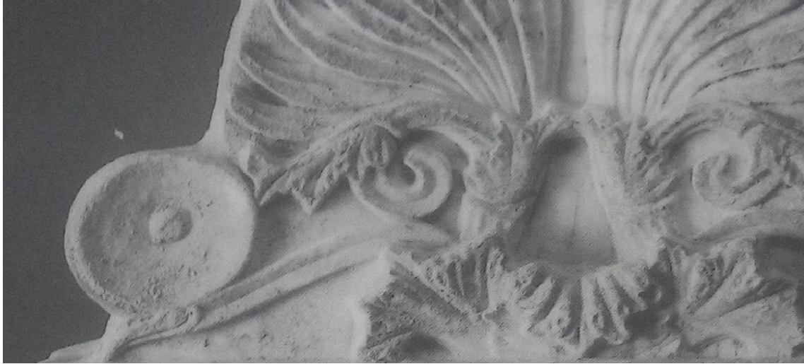
Fig. 2. Ingrandimento sezione sinistra dell'anthemion. Immagine di Clairmont 1991