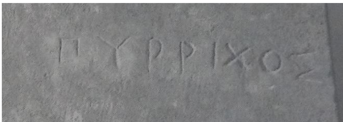
Fig. 5. Nome del defunto. Immagine di Clairmont 1991.